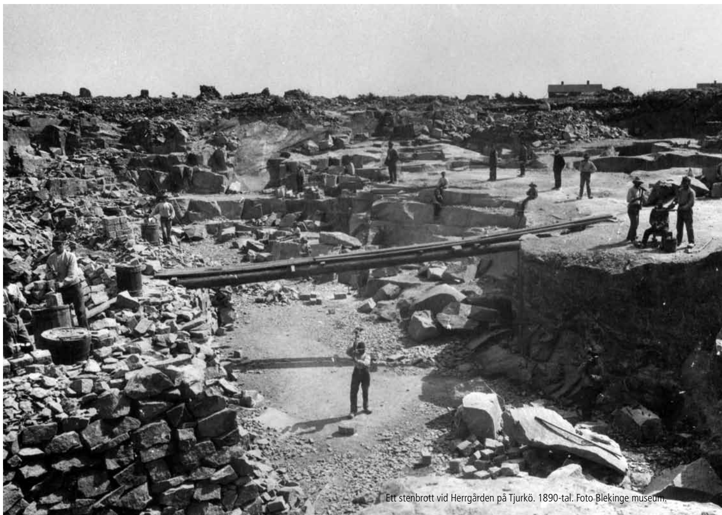
Ett stenbrott vid Herrgården på Tjurkö. 1890-tal.

Genom området löper en markerad vandringsled som passerar flera anläggningar och minnesmärken från stenhuggeriets tid. Hela slingan är cirka 1,5 km lång och utmärkt med punkter på kartan. Ta med foldern och gör en rundvandring! OBS! Stigen är ej tillgänglighetsanpassad.